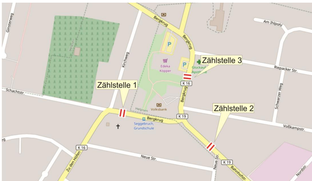
Kartengrundlage: openstreetmap Mitwirkende